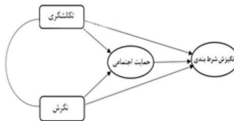
شکل ۱. مدل مفهومی و روابط متغیرهای پژوهش

پرسشنامه نگرش شرط بندی (ATGS-8) ۲ ، که به عامل شناختی و باور اولیه شرط بندی مربوط می شود. این پرسشنامه ۸ سوال داشته و دارای مقیاس پنج ارزشی لیکرت است. در پژوهش حاضر پایایی این ابزار از روش آلفای کرونباخ ۰/۸۳ محاسبه شد.