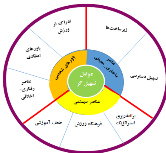
شکل ۱. شناسایی عوامل تسهیل‌گر تنفر دانش‌آموزان از ورزش